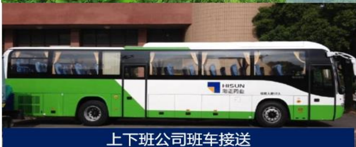
上下班公司班车接送