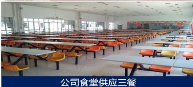
公司食堂供应三餐